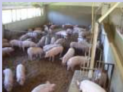
Section sur litière

Nous ne voulons pas faire manger aux autres ce que nous ne voulons pas manger.